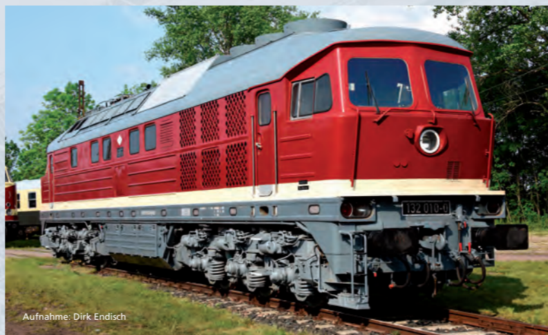
Aufnahme: Dirk Endisch

Obwohl einige der Maschinen bereits 15 Jahre in schweren Diensten standen, bestanden sie auch diese Prüfung mit Bravour. 64 Loks erhielten neue Fahrmotoren und Achsgetriebe, mit denen sie 140 km/h fuhren und als Baureihe 234 noch besser einsetzbar waren. Aber auch die verbleibenden Loks, ab 1994 als 232 der DB AG bezeichnet, bestimmten noch lange Zeit den Alltag auf deutschen Gleisen. Aus ihnen gingen die Baureihen 233 und 241 der DB AG sowie zahlreiche weitere Einsatz- und Farbvarianten bei verschiedensten Eisenbahnverkehrsunternehmen im In- und Ausland hervor. Wer annahm, die Grenze zum dritten Jahrtausend würden nur noch wenige „Ludmillas“ überfahren, sah sich getäuscht: Den letzten Maschinen dieser hochbewährten Baureihenfamilie kann man noch heute begegnen.